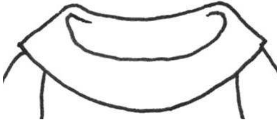
Kragen vom Carmenshirt