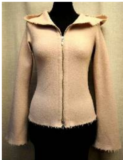
Kapuze am Beispiel von J-001